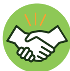
Toque ou aperto de mãos