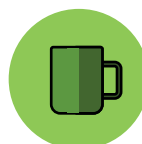
Objetos ou superfícies contaminadas